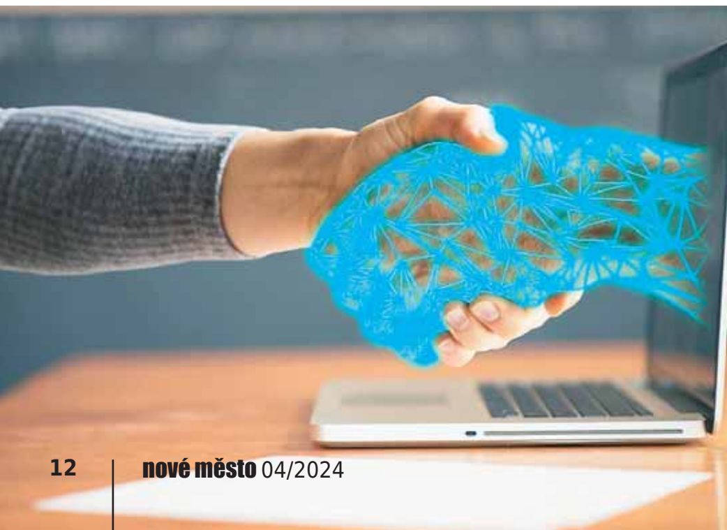
Ilustrační foto: Pixabay