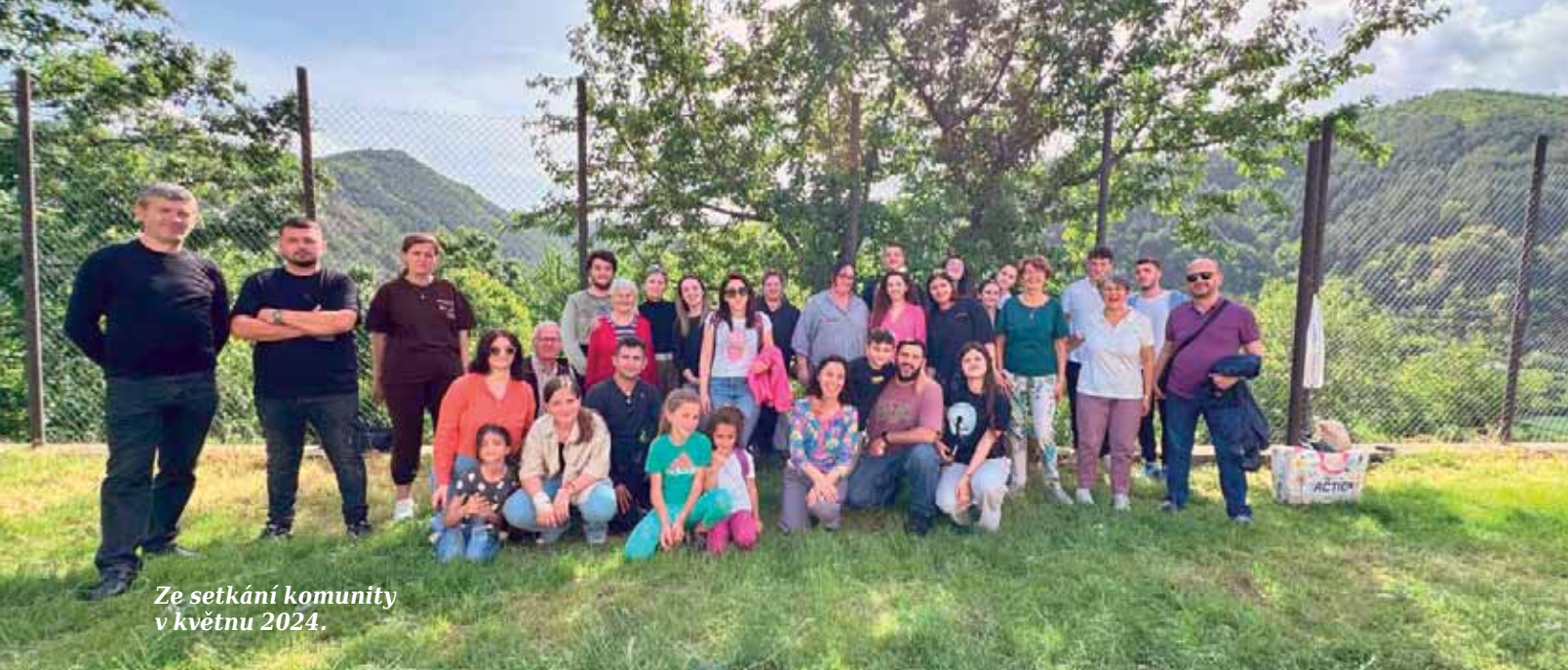
Ze setkání komunity v květnu 2024.